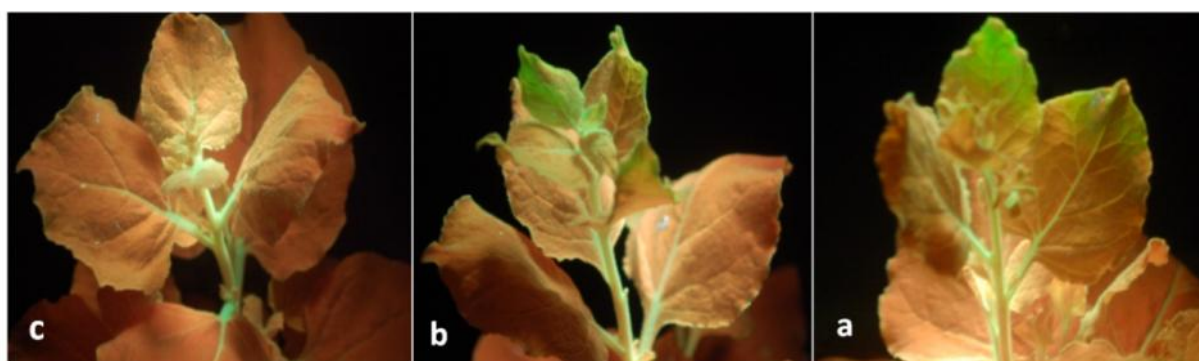
شکل ۱- مایه‌زنی GFLV روی گیاهان تراریخته N. benthamiana و تیمار شده با ویروس جغجغه‌ای توتون (TRV). (a) مایه‌زنی با نژاد GFLV-F13. (b) مایه‌زنی با نژاد GFLV-GHu. (c) گیاه تراریخته N. benthamiana و تیمار شده با pTRV بدون مایه‌زنی با GFLV به عنوان کنترل.

Figure 1- GFLV inoculation on transgenic N. benthamiana and treated with pTRV. a) GFLV-F13 inoculation. b) GFLV-GHu inoculation. c) Transgenic N. benthamiana and treated with pTRV without GFLV inoculation as control.