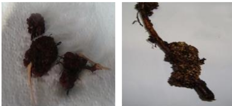
شکل ۱- سمت راست: گرهک ریشه‌ای درخت سنجد، سمت چپ: گرهک ریشه‌ای درخت توسکا Figure 1. Right: Root nodules of Russian olive, Left: Root nodules of alder

MR-VP، مصرف سترات، تجزیه نشاسته، تجزیه ژلاتین، تجزیه کازیین، اکسیداسیون یا تخمیر قندها (OF)، مصرف اوره و احیای نیترات شناسایی شدند (Faghanizadeh et al. 2016). جدایه‌های قارچی نیز در محیط سابورد دکستروز آگار کشت داده شد و در ۲۸ درجه سانتی‌گراد به مدت ۴۸ ساعت گرماگذاری شد. قارچ‌های رشد یافته با لاکتوفنل کاتن بلو رنگ‌آمیزی و در زیر میکروسکوپ از نظر مورفولوژیکی بررسی و در نهایت با روش مولکولی و تکثیر توالی فاصله اندازهای رونویسی شونده داخلی (ITS) شناسایی گردید (Mahuku, 2004).