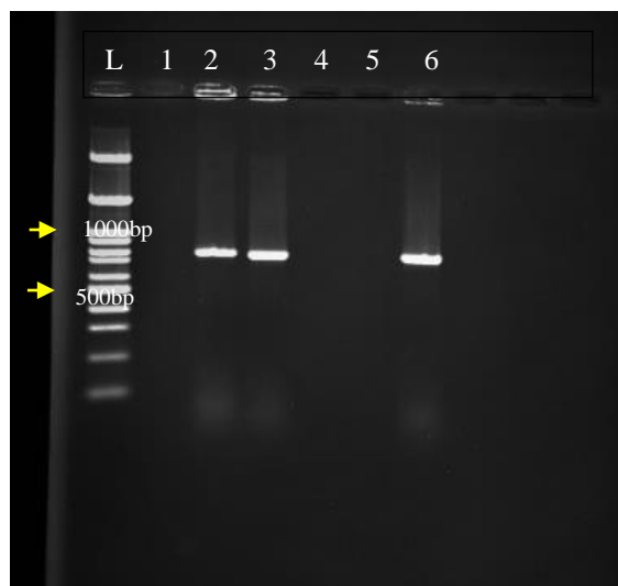
شکل ۲- تجزیه و تحلیل PCR قطعه ۷۸۰bp ژن rolB ریشه‌های موئین در پریلا. نوار ۱ مربوط به آب، نوارهای (۲ و ۳) به مربوط به دو نمونه از ریشه‌های موئین القا شده، نوار ۴ و ۵ مربوط به ریشه معمولی (کنترل منفی)، نوار ۶ مربوط به پلاسمید باکتری (کنترل مثبت)، نوار L مربوط به لدر ۱۰۰ bp.

در این مطالعه اثر متقابل ریزنمونه و سویه باکتری بر روی القای ریشه موئین در گیاه دارویی پریلا مورد ارزیابی قرار گرفت. نتایج دال بر آن بود که صفات روز تا القای ریشه موئین، درصد القای ریشه موئین، وزن تر و خشک ریشه‌های موئین پس از دو ماه، به طور معنی‌داری متأثر از اثر متقابل عوامل مورد بررسی بوده است. القا ریشه‌های موئین در ترکیب تیماری ریزنمونه کوتیلدون و ATCC18534 سریعتر از سایر ترکیبات تیماری مورد مطالعه بود. بیشترین میزان وزن تر و خشک ریشه موئین در ترکیب تیماری سویه ATCC15834 و ریزنمونه کوتیلدون حاصل شده و به طور معنی‌داری نسبت به سایر ترکیبات تیماری بیشتر بوده است. نتایج برش‌دهی اثر متقابل سطوح مختلف ریزنمونه در هر سطح از باکتری نشان داد که در سویه ATCC15834 ریزنمونه کوتیلدون نسبت به دیگر ریزنمونه‌ها بیشترین میزان وزن تر و خشک ریشه‌های موئین را تولید کرده است. در حالی که در بین ریزنمونه‌های تلقیح شده با سویه A4 دو ریزنمونه هیپوکوتیل و میانگره ساقه بیشترین میزان وزن تر و خشک ریشه موئین را تولید کرده که دال بر اثر متقابل ریزنمونه و سویه باکتری است. ماهیت تراریختی ریشه‌های موئین با استفاده از ردیابی قسمتی از ژن rolB با به کارگیری واکنش PCR تایید شد در حالی که برای ریشه‌های طبیعی و غیرتراریخته نوار مربوطه تکثیر نشد. بطور کلی نتایج این مطالعه نشان داد که رشد و عملکرد ریشه‌های موئین متأثر از ریزنمونه و سویه باکتری است و در مطالعات آینده کشت ریشه‌های موئین پریلا می‌تواند یک جایگزین مناسب برای تولید سریع متابولیت‌های دارویی در آن تحت شرایط درون شیشه‌ای محسوب گردد.