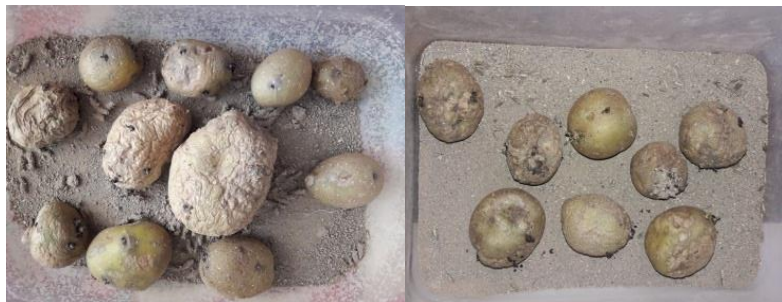
شکل ۱- ظروف پرورش بید سیب‌زمینی حاوی خاک استریل

که دهانه آن با توری پارچه‌ای مسدود شده بود منتقل گردید. جهت تغذیه حشرات کامل، بالای ظروف روی توری پنبه آغشته به آب غسل ۱۰ درصد قرار گرفت. کاغذهای حاوی تخم بید سیب‌زمینی روزانه برداشت شده و برای انتقال روی غده‌های سیب‌زمینی برای تکثیر و یا مطالعات طراحی شده مورد استفاده قرار گرفت (Furong & Zhengue, 2003).