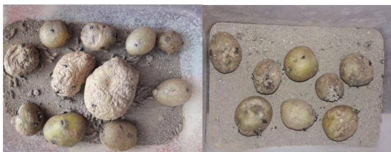
شکل ۱- ظروف پرورش بید سیب‌زمینی حاوی خاک استریل

که دهانه آن با توری پارچه‌ای مسدود شده بود منتقل گردید. جهت تغذیه حشرات کامل، بالای ظروف روی توری پنبه آغشته به آب غسل ۱۰ درصد قرار گرفت. کاغذهای حاوی تخم بید سیب‌زمینی روزانه برداشت شده و برای انتقال روی غده‌های سیب‌زمینی برای تکثیر و یا مطالعات طراحی شده مورد استفاده قرار گرفت (Furong & Zhengue, 2003).